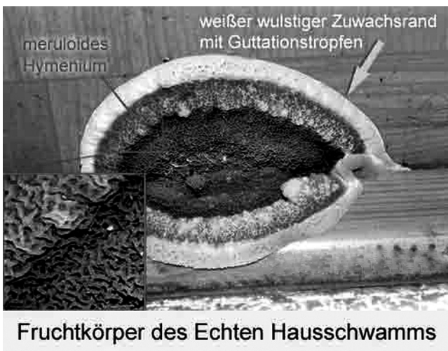
Fruchtkörper des Echten Hausschwamms

Da der braune Kellerschwamm höhere Holzfeuchte benötigt (mindestens 50%) sind die Aussichten auf erfolgreiche Bekämpfung bei ihm weit höher. Neben den unter Schimmel beschriebenen Methoden sollte mensch die befallenen Holzteile bis zu 30 cm um die letzte sichtbar-betroffene Stelle entfernen.